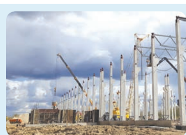
2020 Начато строительство нового завода «Капри» на территории технопарка «М-10» в г. Никольское Ленинградской области.