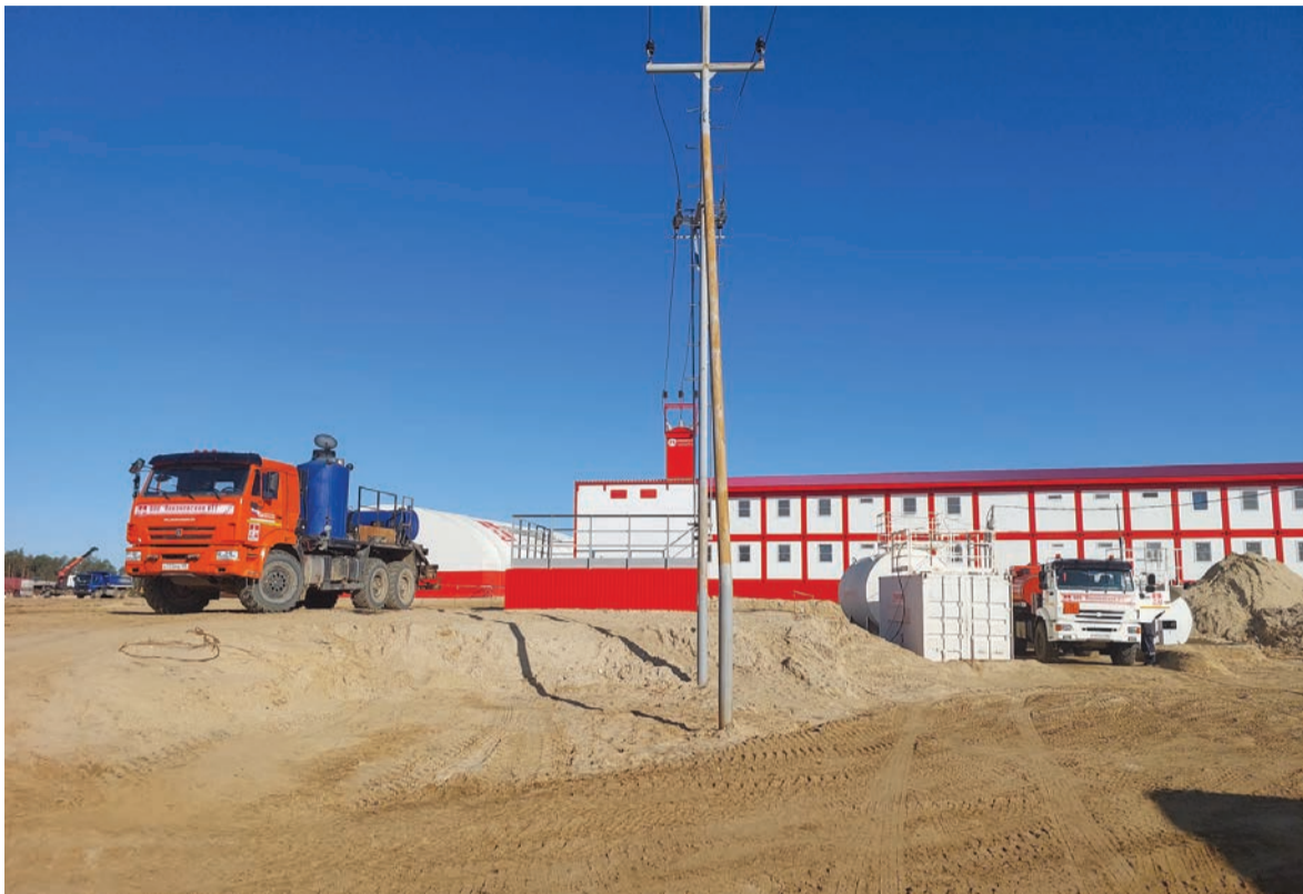
➤ Производственная база, построенная ООО «Покачевское УТТ» на Средне-Назымском месторождении.

Большое влияние на реализацию инвестпрограммы оказывает складывающийся дефицит на рынке отечественных полноприводных шасси с колесной формулой 6х6 для промышленной спецтехники. Это приводит к ажиотажу и спекуляции, — за прошлый и текущий годы цены на эту технику выросли вдвое. В связи с этим мы начали поиск альтернативных моделей, выпускаемых «КамАЗом» и «Заводом Урал». Было рас-