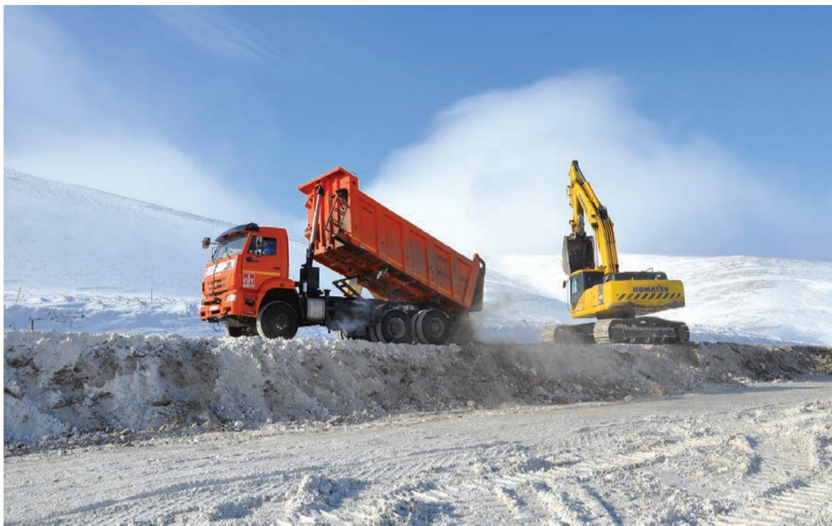
➤ Дорожники «ДТК Ямал» ведут строительство руслоотвода ручья Чужой на площадке «Черногорского ГОК» в Норильске.

По проекту «Рудник Заполярный». Комбинированная отработка оставшихся запасов