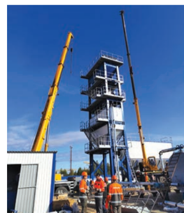
Идет монтаж нового АБЗ ООО «Дорстройсервис».

Монтаж и пусконаладочные работы нового комплекса на пло-