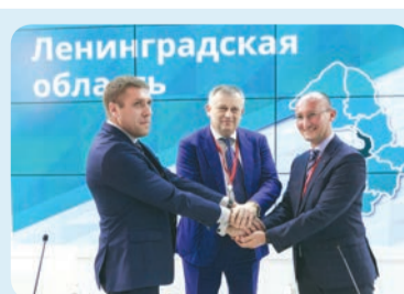
2019 В феврале на XVIII Российском инвестфоруме в Сочи подписано Соглашение с правительством Ленинградской области о строительстве роботизированного производственного комплекса «Капри».