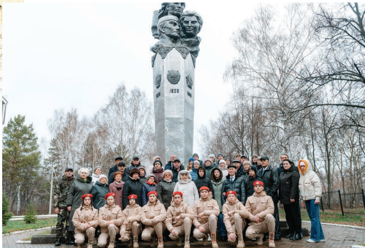
➤ На Аллее Героев с Буздяк после возложения цветов.

– Я помню, как отец приходил в отпуск осенью 44-го. Мне тогда было четыре года. Значит, играем мы с ребятами на улице,