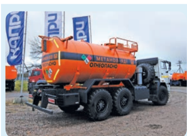
2017 «Капри» входит в состав АО «Спецнефтетранс». Завод приступил к выпуску нефтепромысловой техники. Первая «АКН-10» пополнила парк ООО «Когалымское УТТ».