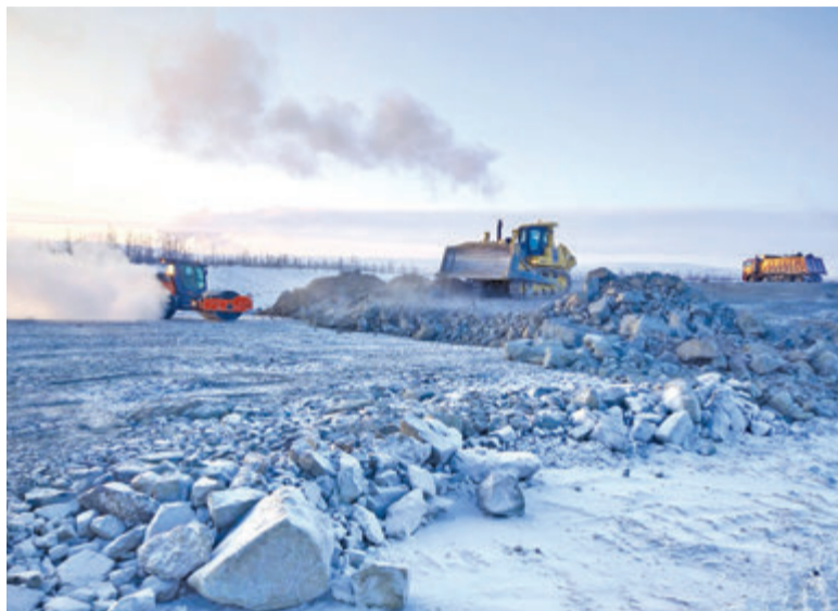
➤ ДТК Ямал» на объектах работ в Норильске

Подводя итоги работы в Норильске за этот год, отмечаю, что на Мокулаевском месторождении