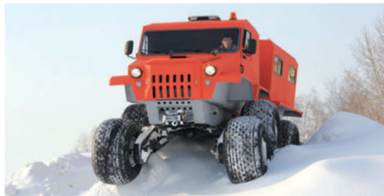
➤ Чернушинскому «Борею» по плечу любое бездорожье!

Пусть он станет знаменательным в плане побед, успеха, достижений и профессионального роста. Желаем компании лидерства в отрасли и новых интересных проектов! Обществу — благосостояния! Сотрудникам — крепкого здоровья и семейного благополучия!